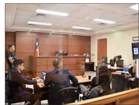
Pasado el mediodía de ayer comenzó la formalización de la directora de TomArte.

Con la acusación, se espera el pronto inicio del juicio oral, sin embargo, intervinientes pidieron nuevas diligencias que forzaron la reapertura de la investigación por cerca de un mes.