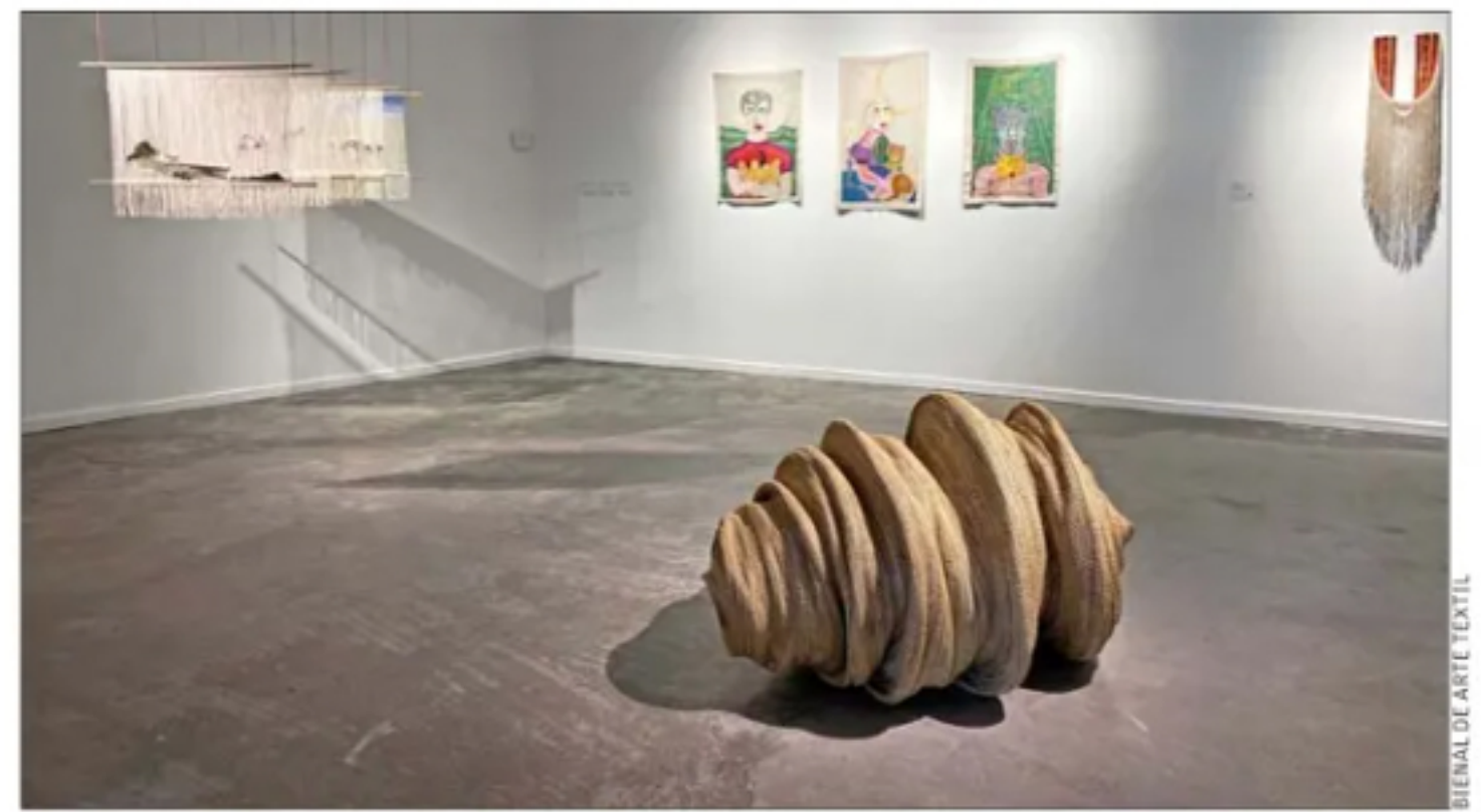
Una selección de la Bienal de Arte Textil (BAT) llegó a mediados de marzo a la Universidad Católica de Temuco. A las obras de siete artistas provenientes de Santiago y de la exposición original, realizada en 2023, se sumó el trabajo de tres artistas del sur.

Museos como el de Arte Contemporáneo (MAC) y el Nacional de Bellas Artes