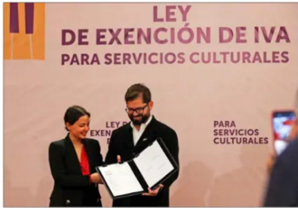
Nueva ley: el Presidente Boric y la ministra Arredondo en la promulgación de la Ley de Exención del IVA para Servicios Culturales.